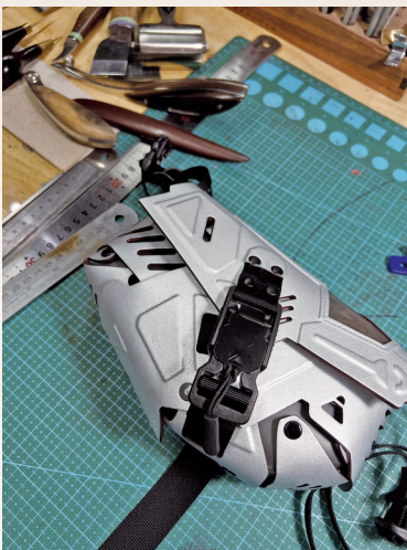
“碎片能量转化器”可以任意拆分组合,更符合当代青年审美。

不同区域,不同工艺,贴不同的皮。“一个小小的提手,拆开看里面其实有很多层。但是这是我们必须要去经历的过程。传统工艺要被大众了解和认识,就要和日常使用的物品相结合。”雷镭认为。