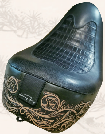
摩托车坐垫根据不同车型、不同改装效果单独定制。