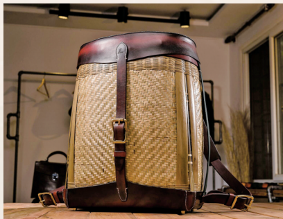
传统手编竹篓与牛皮完美结合,获得第十届中国青少年艺术节重庆赛区决赛青年组一等奖。