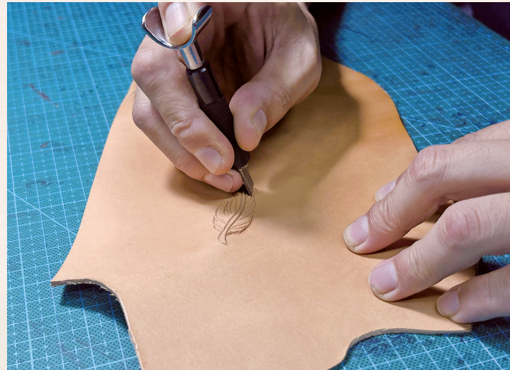
用刻刀在皮上“作画”,最讲究力度和手感。