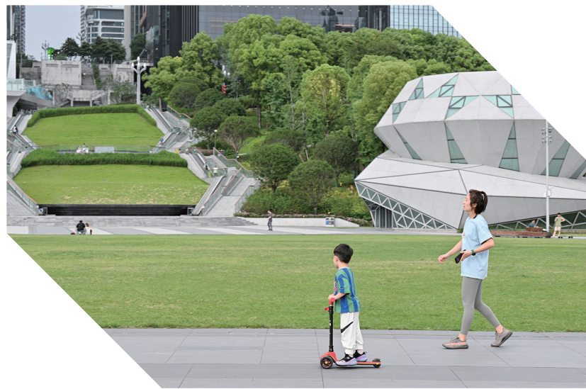
▲在钻石广场享受快乐的亲子时光