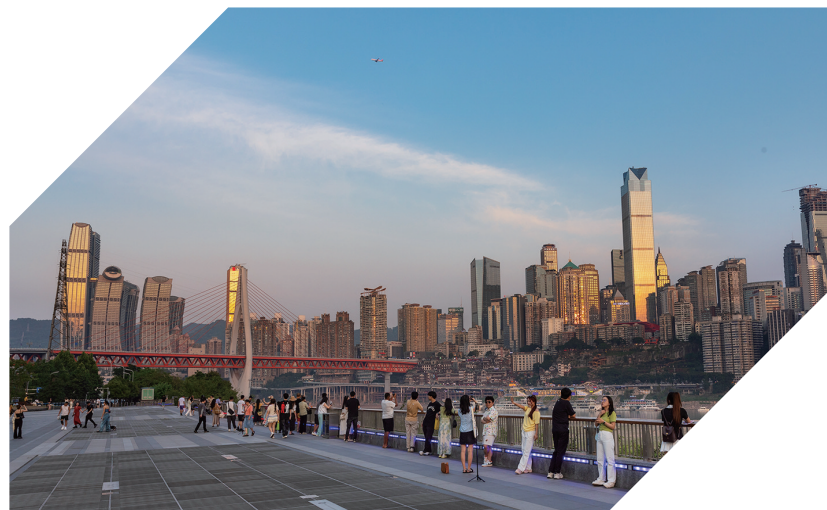
▲在钻石广场打卡“重庆曼哈顿”