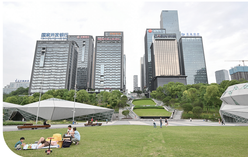
▲开阔的草坪成为市民休闲娱乐的首选之地

北滨路的钢筋森林里,藏着专属于山城的魔法剧本——钻石广场与江北a~台,正上演着“操控单轨”的超现实戏码。列车不再是穿梭城市的交通工具,而是被光影与视角驯服的精灵,等你用镜头解锁隐藏剧情。