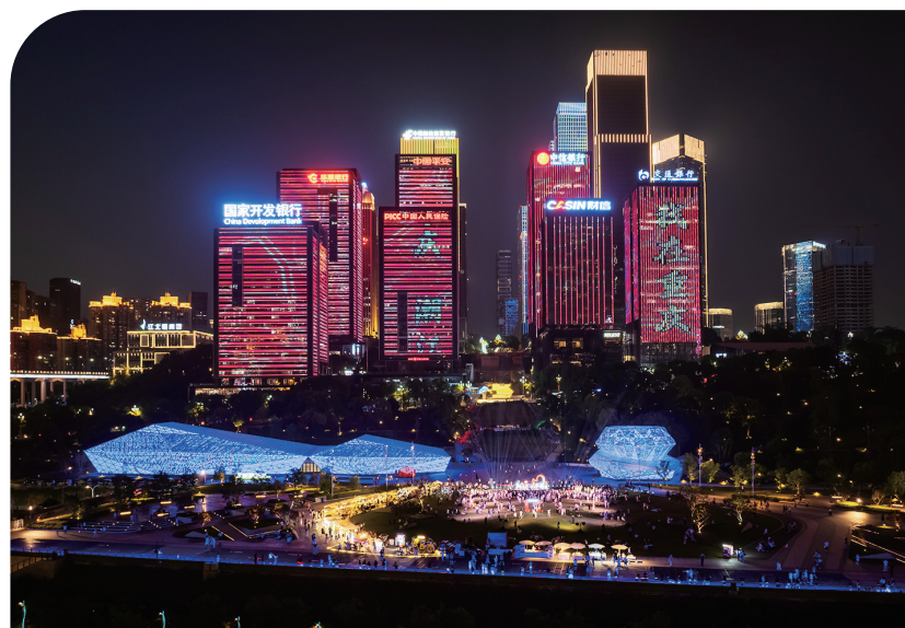
▲夜幕下的钻石广场熠熠生辉