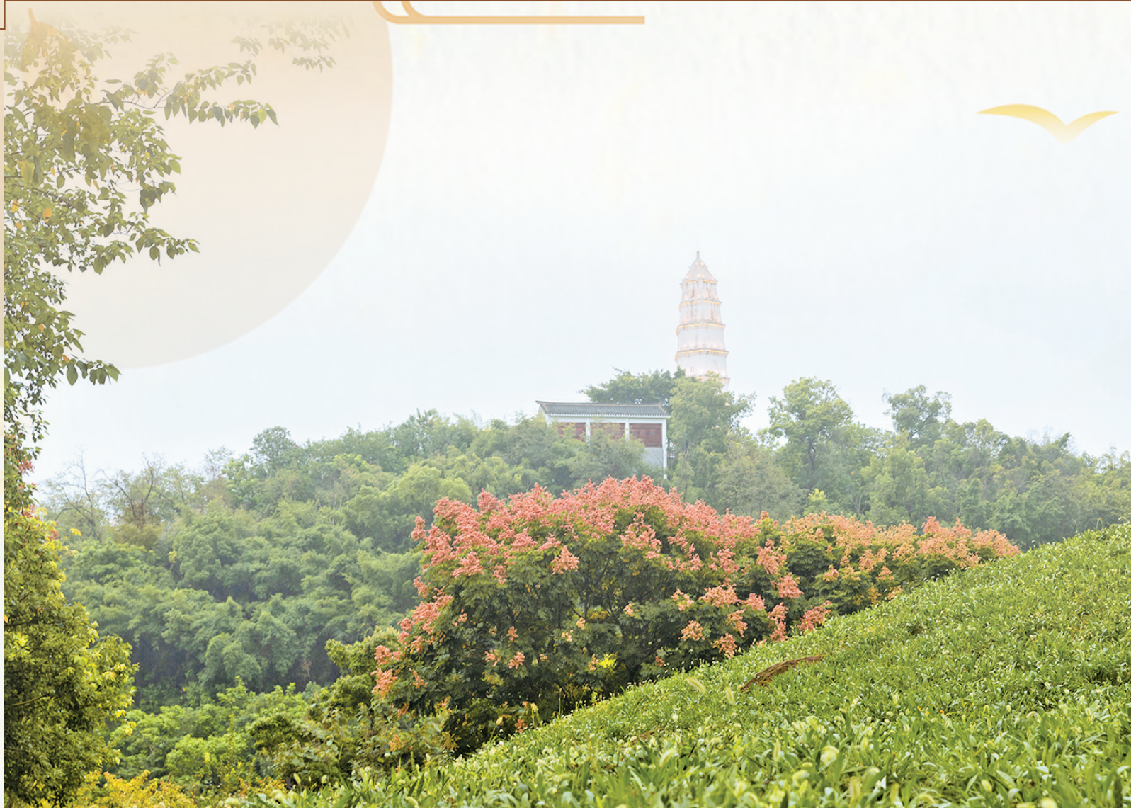
秋日的塔山公园,栎树果实红透,远处的文峰塔在林木簇拥下静静伫立,勾勒出一幅山林秋景图。