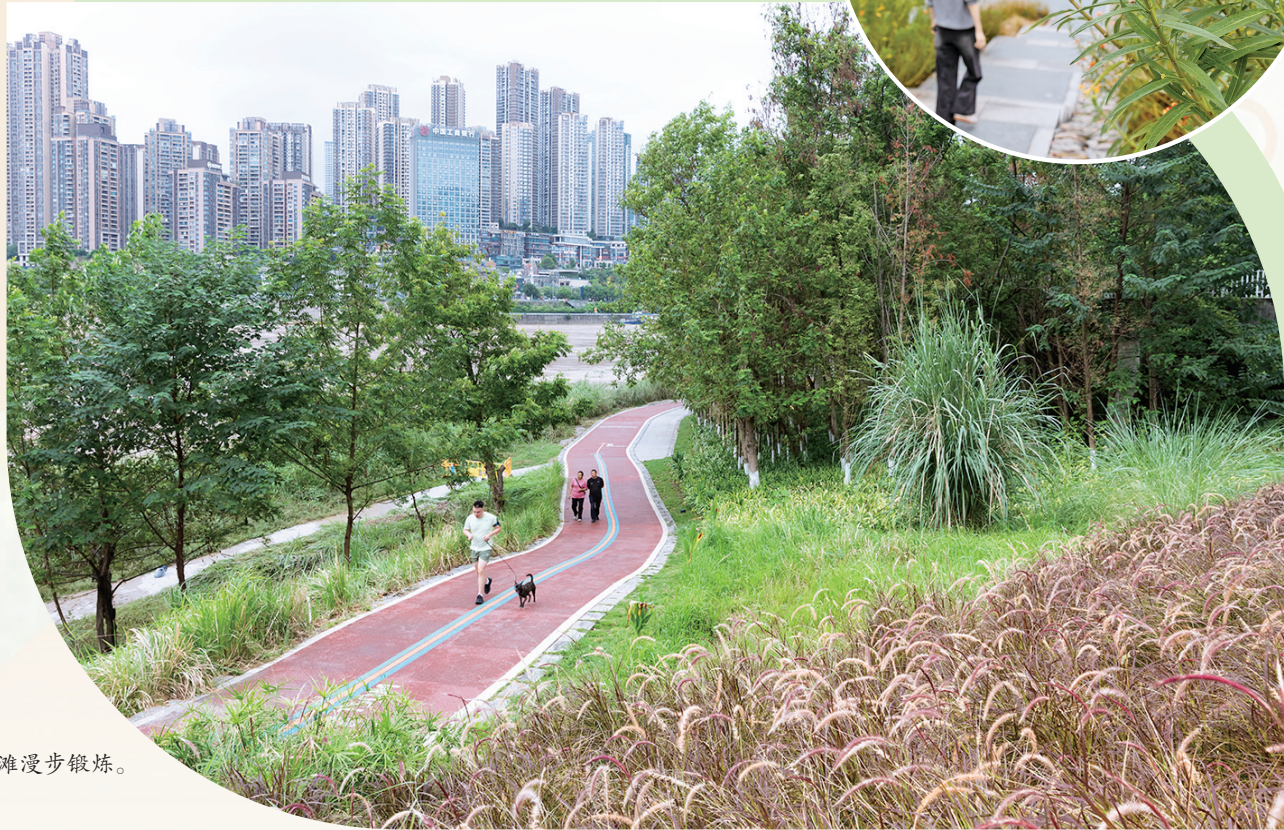
市民在江滩漫步锻炼。

去江北嘴江滩吹江风吧！ 卸下心头的琐事， 邀一位知心好友，或与亲密的人并肩， 沿着堤岸漫无目的地散步。 芦苇如浪，脚边掠过蓬松的金芒， 江风裹着水汽扑来，翻卷着细碎的波光， 话音散在风里。