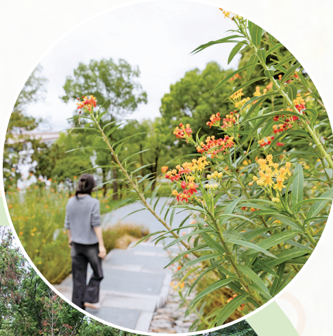
黄花园大桥 北桥头桥下一隅。