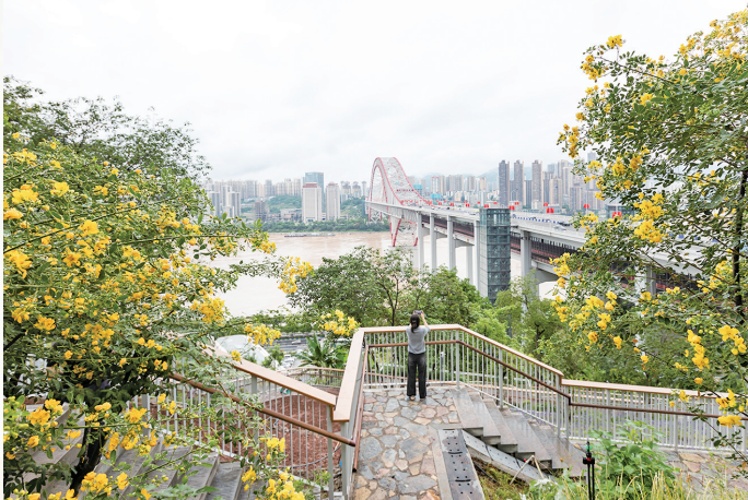
川江航运文化园步道边,黄槐决明的花朵在枝头热烈绽放。