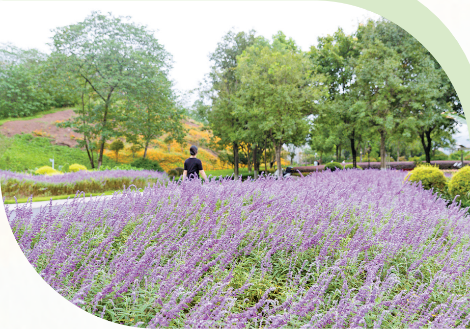
鼠尾草花海如紫色的云霞般绚烂。